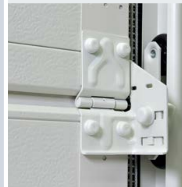
Kování a vodící kolejnice v šedobílé RAL 9002

** technika pružin včetně držáku, zajištění proti prasknutí pružiny, lanový buben, kolejnice pohonu pozinkované